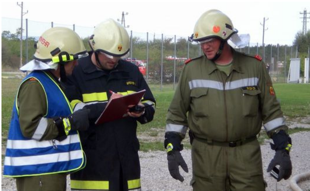
alle Personen gerettet - BRAND AUS um 16:15h